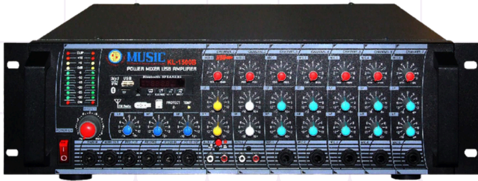
เครื่องขยายเสียง เสียงตามสาย